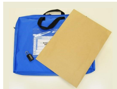
(例)書類や電子媒体の配送など

輸送には、ダイヤルロック付きの専用バッグを使用いたします。輸送の行程で荷物の中身が第三者の目に触れていない旨を、荷受人さまに示すことをサービスの主眼に置いております。